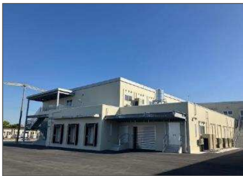
水産加工施設（外観写真）